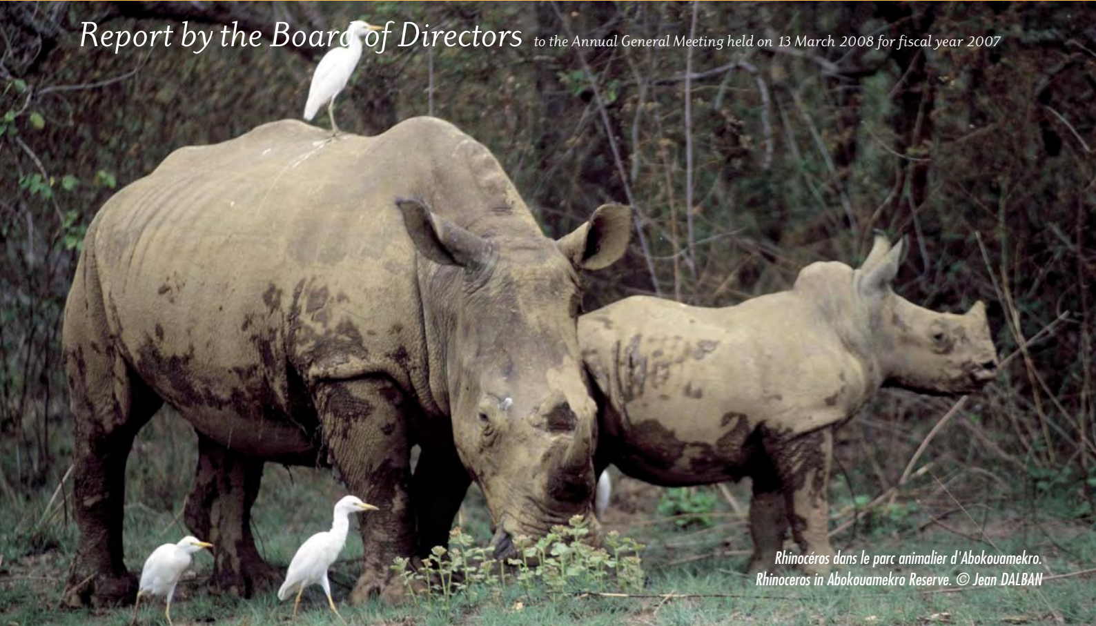
Rhinocéros dans le parc animalier d'Abokouamekro. Rhinoceros in Abokouamekro Reserve.

Report by the Board of Directors to the Annual General Meeting held on 13 March 2008 for fiscal year 2007