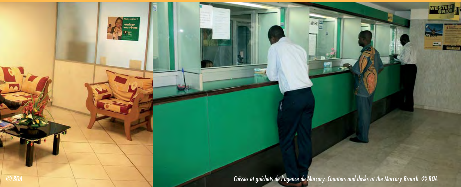
Caisses et guichets de l'agence de Marcory. Counters and desks at the Marcory Branch.

de ressources tirées exclusivement de la clientèle. Par cette performance, la BOA-CÔTE D'IVOIRE obtient une part de marché de 7,3 %, qui la porte au 6 e rang des banques, selon le classement de l'Association Professionnelle des Banques et Établissements Financiers.