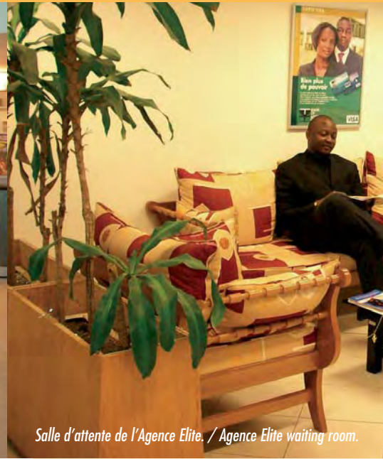
Salle d'attente de l'Agence Elite. / Agence Elite waiting room.