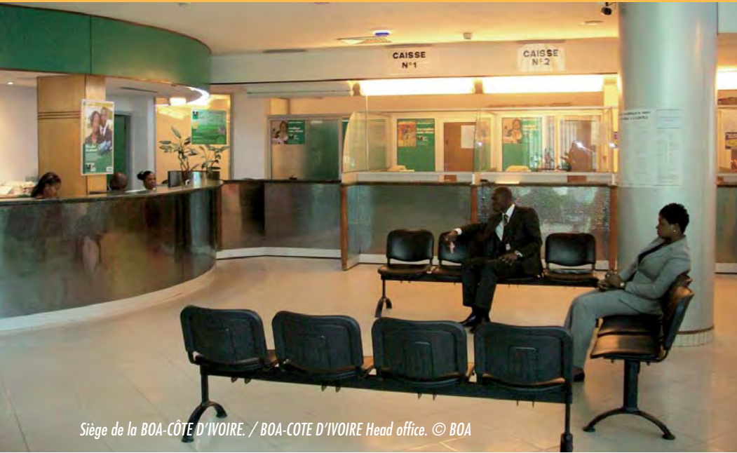
Siège de la BOA-CÔTE D'IVOIRE. / BOA-COTE D'IVOIRE Head office.