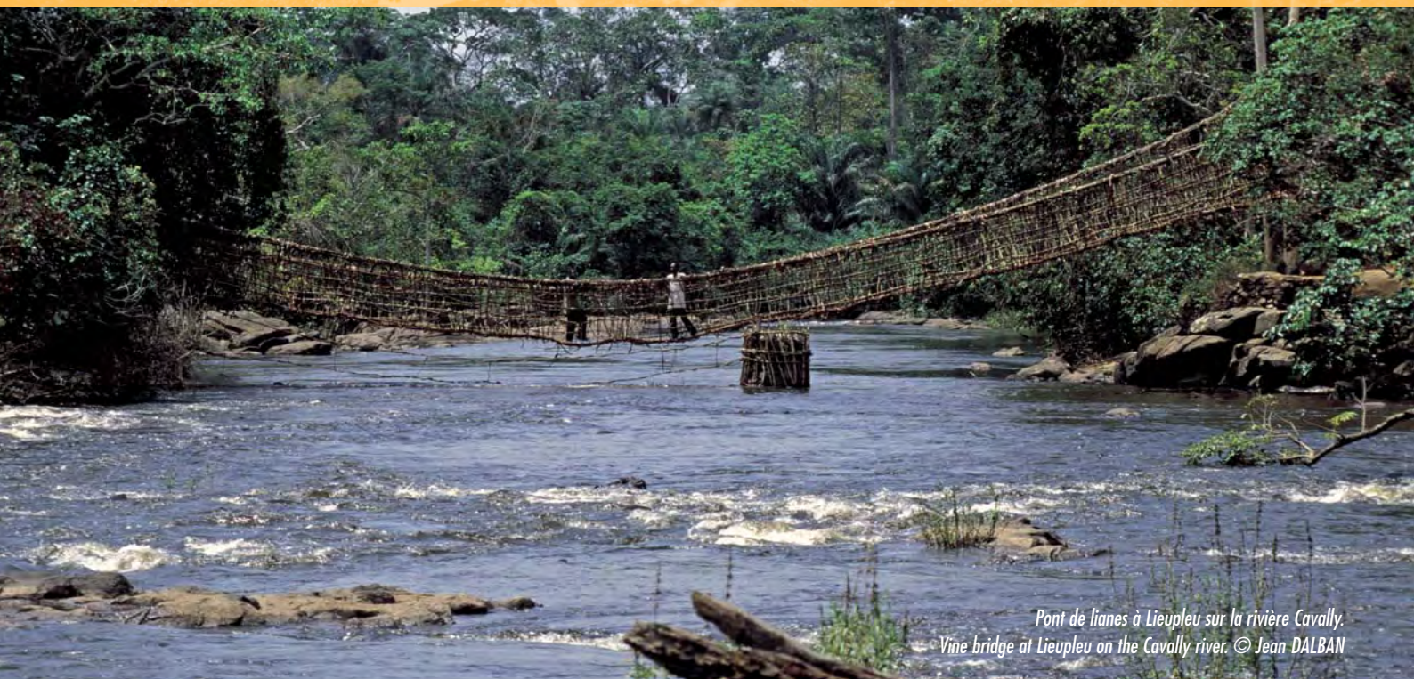
Pont de lianes à Lieupleu sur la rivière Cavally. Vine bridge at Lieupleu on the Cavally river.