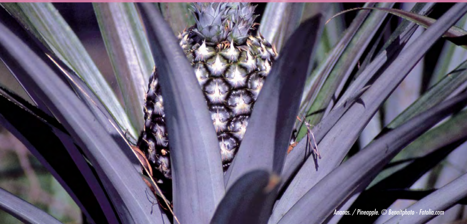
Ananas. / Pineapple.