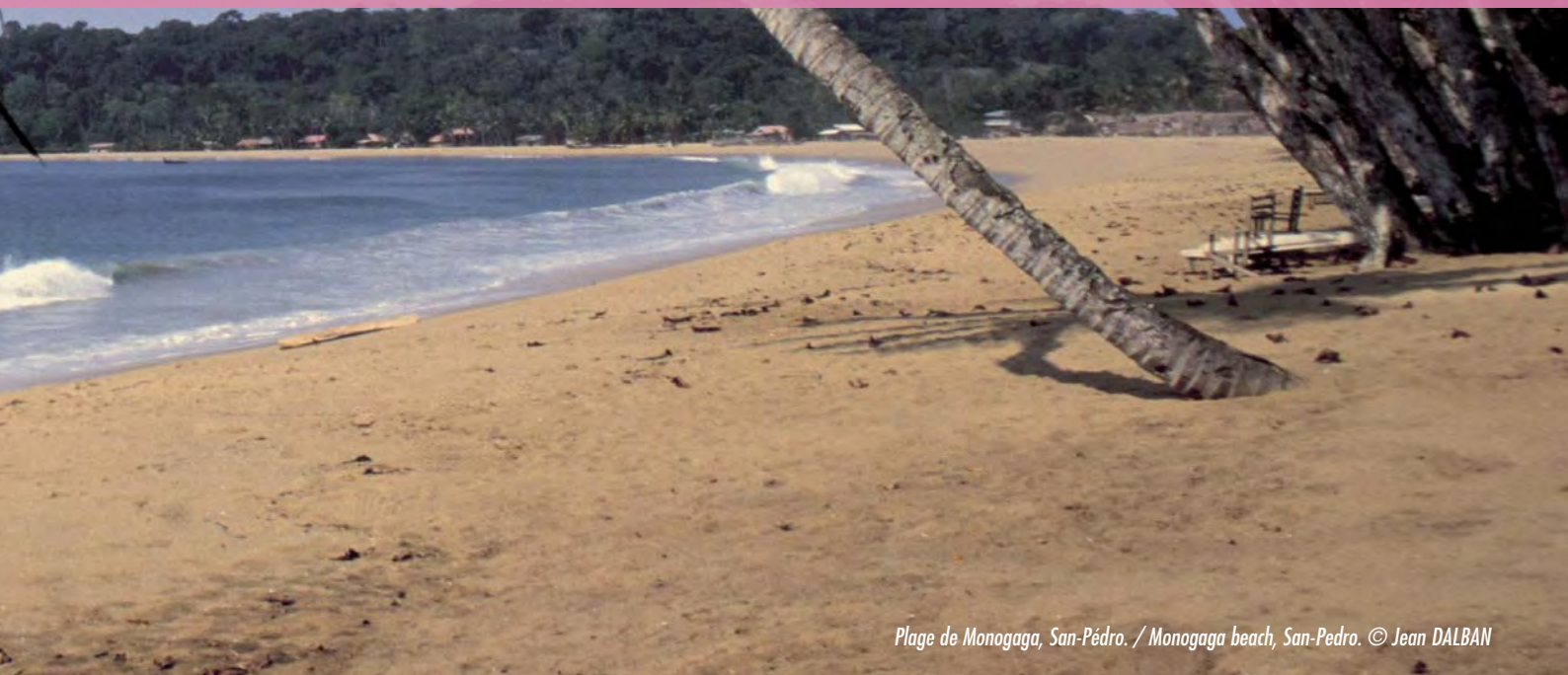
Plage de Monogaga, San-Pédro. / Monogaga beach, San-Pedro. © Jean DALBAN