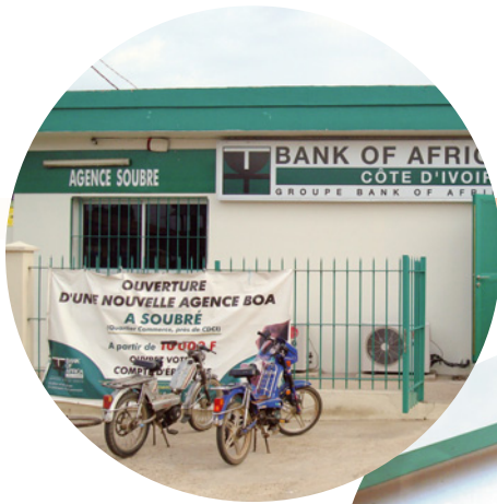
1 La nouvelle Agence de Soubré. The new Soubré Branch.