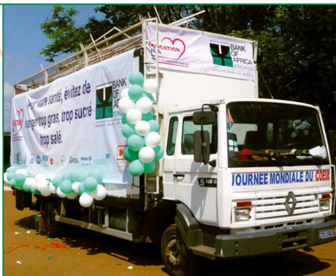
② Caravane de sensibilisation de la Journée du Cœur.