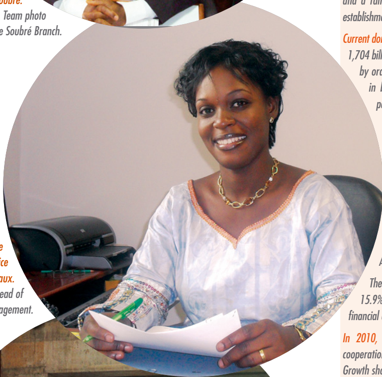
La responsable du Service Moyens généraux.