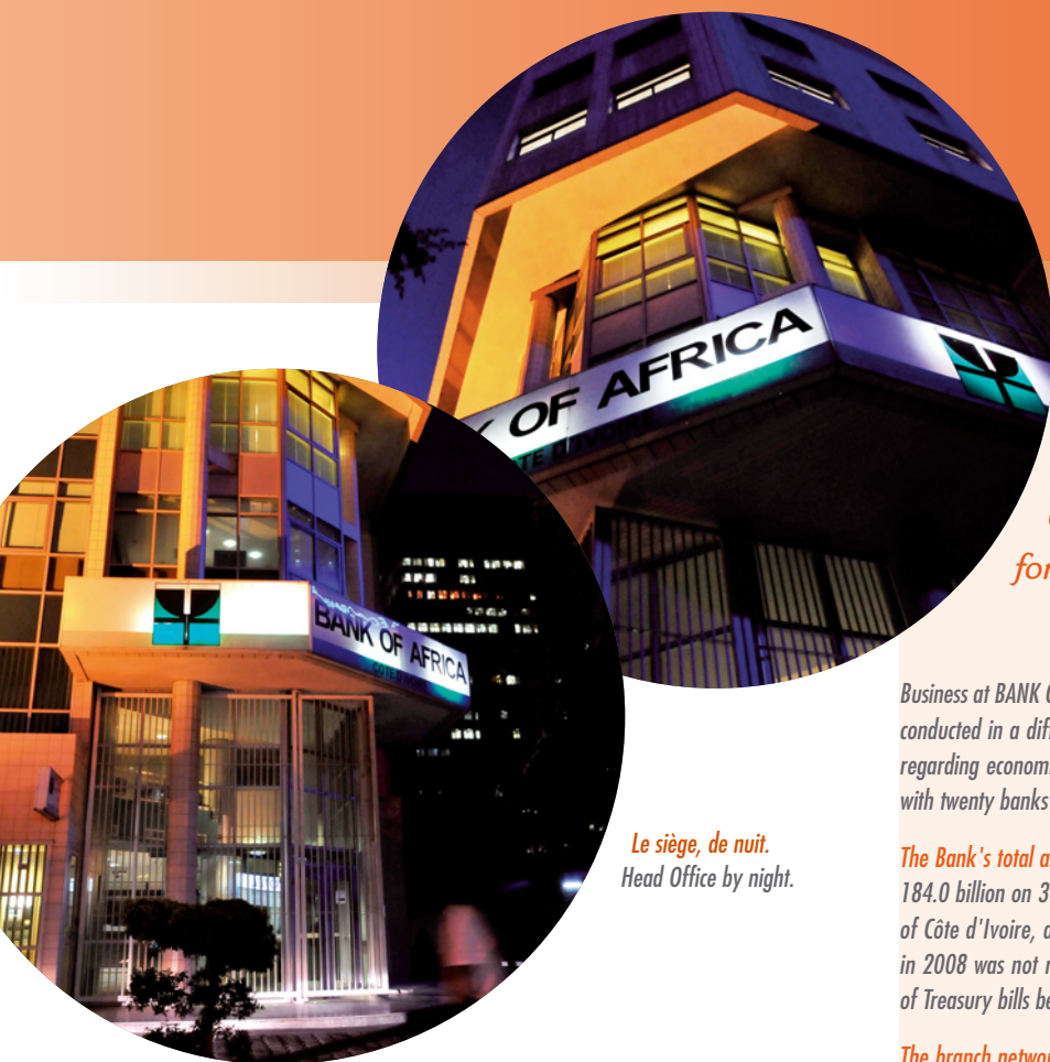
Le siège, de nuit. Head Office by night.