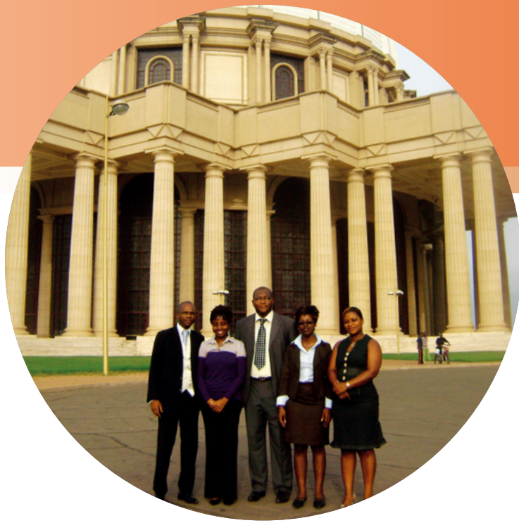
L'équipe de l'Agence de Yamoussoukro devant la basilique Notre-Dame de la Paix. The Yamoussoukro Branch team, in front of Notre-Dame de la Paix basilica.

déficit de 41 milliards de F CFA à la même période en 2008, soit une amélioration de 134 milliards de F CFA. Cela est dû, d'une part, à l'accroissement des recettes fiscales, notamment les droits d'enregistrement sur le café et le cacao et les recettes douanières, et, d'autre part, à la forte mobilisation des contributions extérieures enregistrant 257 milliards F CFA de programmes de dons.