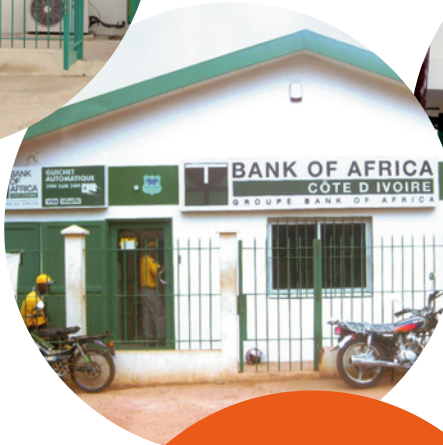
2 La nouvelle Agence de Gagnoa. The new Gagnoa Branch.