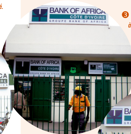
3 La nouvelle Agence de Treichville, à Abidjan. The new Treichville Branch, in Abidjan.