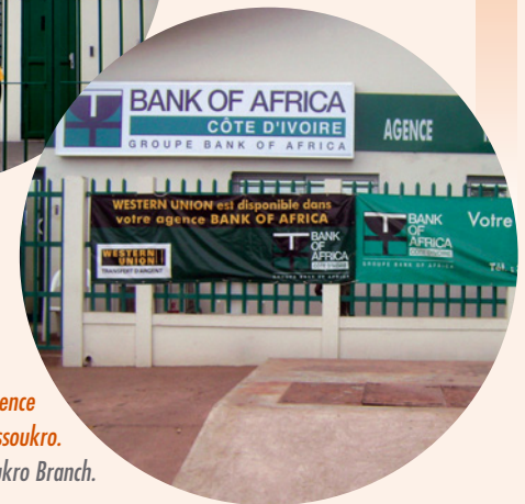
4 La nouvelle Agence de Yamoussoukro. The new Yamoussoukro Branch.