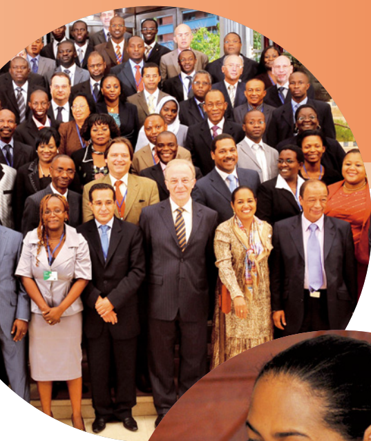
Les Rencontres Cadres BOA 2009, à Abidjan. The Groupe BANK OF AFRICA network management meeting 2009, in Abidjan.